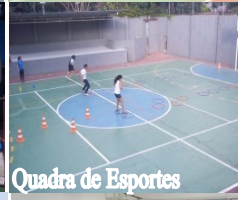
Quadra de Esportes