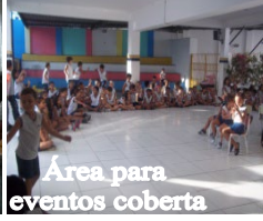
Área para eventos coberta