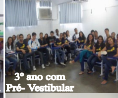
3º ano com Pré- Vestibular