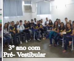
3º ano com Pré- Vestibular