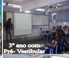
3º ano com Pré- Vestibular