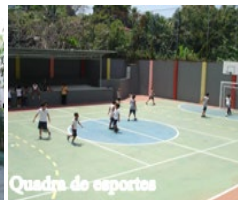
Quadra de esportes