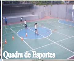
Quadra de Esportes