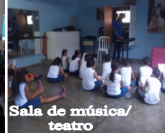
Sala de música/ teatro