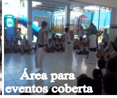
Área para eventos coberta