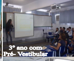
3º ano com Pré- Vestibular