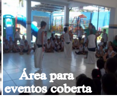
Área para eventos coberta