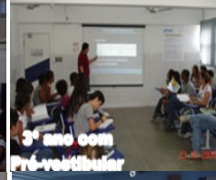
3º ano com Pré-vestibular