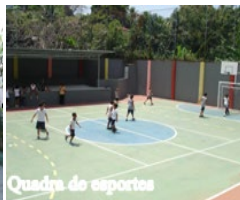
Quadra de esportes