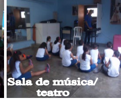
Sala de música/ teatro