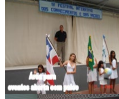
Artes crianças alinha com país