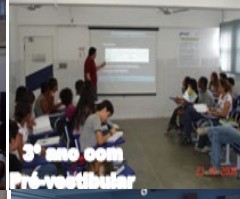
3º ano com Pré-vestibular