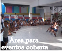
Área para eventos coberta